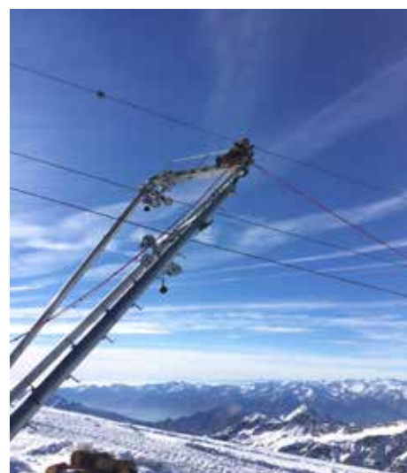
▲ ... mit Asterix 3.2 von Max Jacobi