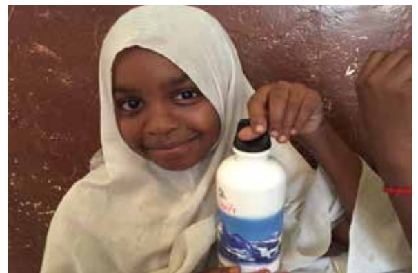
▲ ... im Anschluss an die Schulabschlussfeier den 250 Kindern ausgeteilt und mit riesengrosser Freude empfangen.