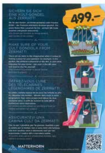
Infolyer zum Gondelverkauf

Die Anlage Gant-Blauherd wird auf den Winter 2016/17 mit einer 6er Sesselbahn ersetzt. Die 50 Gondeln der alten Anlage werden online verkauft.