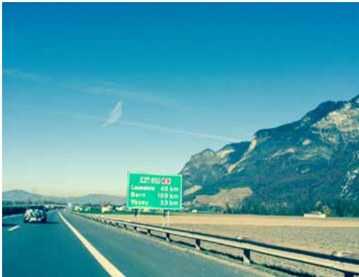
▲ Wem gehört diese Brieftaube? von Bruno Mooser