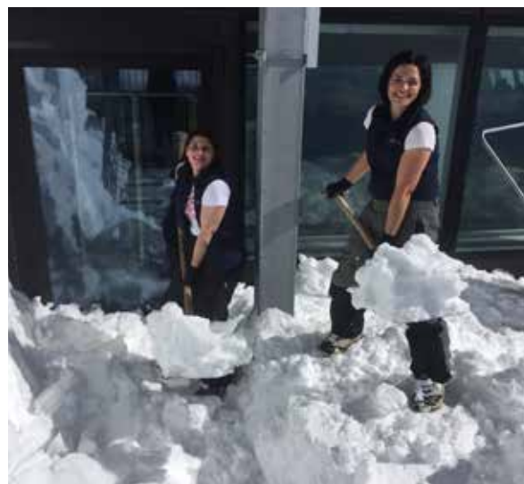
▲ Frauenpower auf Matterhorn glacier paradise von Gabriele Weiss