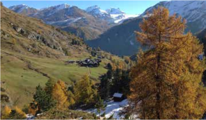
▲ Zmutt von Markus Julen