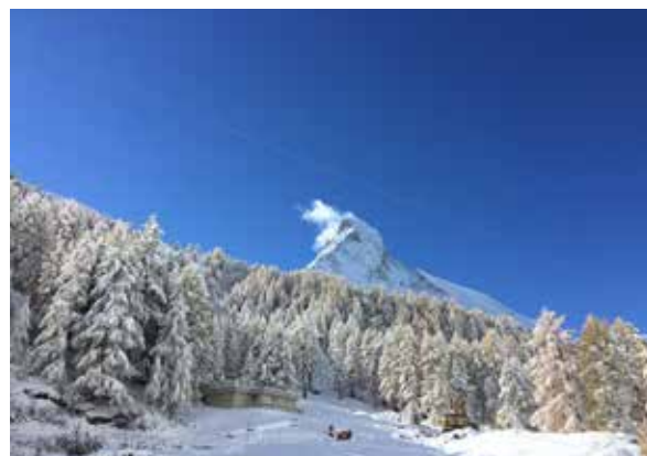
▲ Schnee im Oktober von Andy Imboden